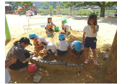
↑ 赤土山は楠の木陰で団子やチョコレート作り