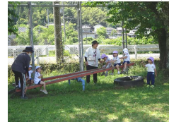
↑ 池内小学校の校庭