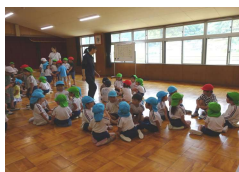
↑ 池内小学校との交流

6月6日(木)に池内小学校の1・2年生と年長クラスが遊戯室で交流活動をしました。28日(金)は中筋小学校との交流です。7月にも、再度池内小学校・中筋小学校の児童と交流する予定です。