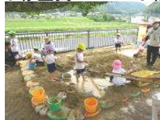
↑ 砂を増やした砂場