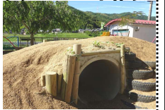
↑ 改造お山トンネル