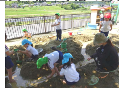
↑ 桜の木の木陰の砂場で川づくり