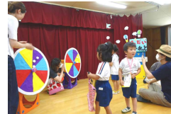
↑ 年中：巨大ルーレット