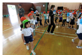
↑ 中筋小学校との交流

年長学年は、中筋小学校へ園バスで行き、1年生と体育館で交流をしました。たくさん的人数でジャンケン列車を楽しみました。また、池内小学校の1・2年生とは、川遊びを楽しみました。新しく購入したライフジャケットを身に付け、暑い日でしたがひんやりとした池内川の水で涼を感じる交流を楽しむことができました。