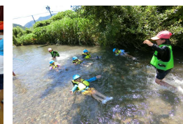
↑ 池内小学校との交流